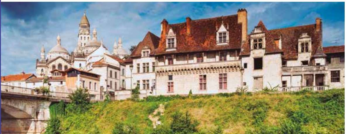
Santiago de Compostela