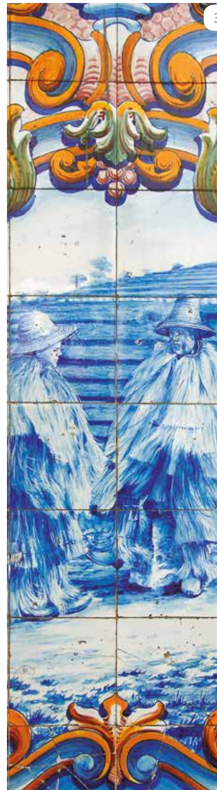
Azulejos Típicos Portugueses