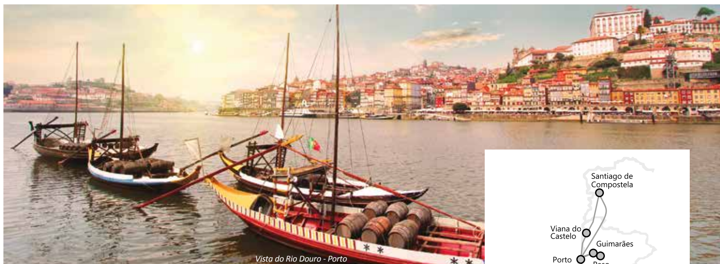
Vista do Rio Douro - Porto

Lisboa - 4 noites | Fátima - 1 noite | Braga - 1 noite | Santiago de Compostela - 1 noite | Porto - 4 noites